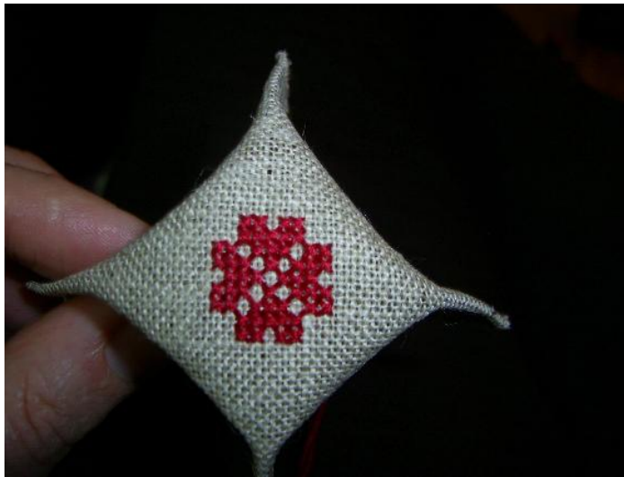
Vue de dessous

"Pincez" un peu les arêtes pour mettre en forme.